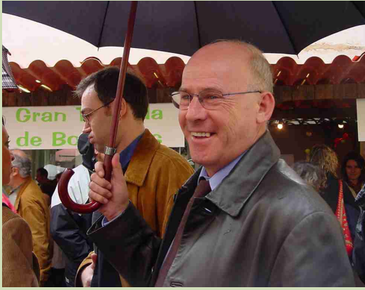
Pere Vigo i Sallent, Cap de llista d'ERC per Girona.

Nascut a Ribes de Freser (Ripollès), on resideix, el 13/09/1952. Alcalde de l'Ajuntament de Ribes de Freser des del 1995. Vicepresident de la Federació de Municipis de Catalunya (1997-1999). Conseller comarcal del Ripollès (1995-1999). Diputat al Parlament de Catalunya (1999-2003).