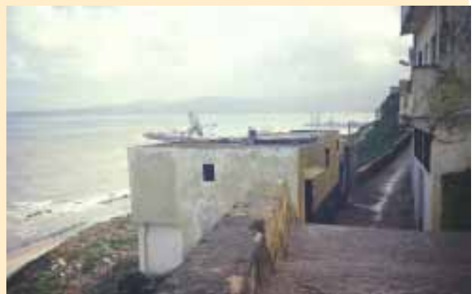
La barrera de l'estret és una temptació massa fàcil per no ser franquejada.

És cert que no tots els elements són negatius i valorem positivament el paquet de modificacions legislatives per lluitar contra les màfies que trafiquen amb immigrants irregulars amb un enduriment de les condemnes imposades, especialment si el propòsit últim és l'explotació sexual, o considerar delictes les mutilacions genitals femenines però ho veiem més com un picar l'ullet a les ONG perquè no se'ls hi tirin al damunt que creure realment el que prediquen.