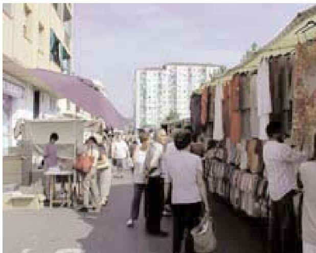
Mercat al barri de l'Erm de Manlleu

Una de les problemàtiques més incidents en l'actualitat és el fet de poder disposar d'un habitatge amb unes mínimes condicions de dignitat i a un preu raonable, sobretot pels joves. També és un problema, en aquests cas afegit, per la majoria dels nouvinguts, sobretot si no disposen de treball o tenen pocs recursos econòmics. Llavors és quan es fa més necessari i imprescindible que l'administració actuï i reguli el sector. I l'administració ha d'actuar i en aquest cas concret ha començat a actuar. El Parlament de Catalunya va aprovar el maig del 2004, la Llei 2/2004 de Millora de Barris, àrees urbanes i viles que requereixen atenció especial. La llei regula la rehabilitació integral de diversos barris de tot Catalunya per evitar-ne la degradació. Aquesta llei impulsada pel Govern, respon a una de les prioritats de la Generalitat: la intervenció integral de